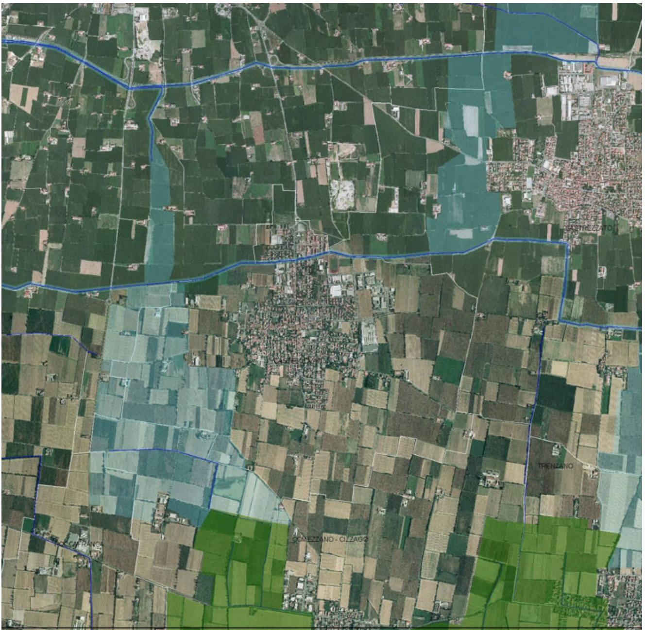
estratto della Rete Ecologica Regionale (RER) con indicato il confine comunale di Castelcovati